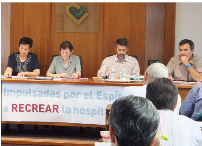
Comisión para la reestructuración de España

Con el objetivo de unificar en 2016 las provincias de Barcelona, Madrid y Palencia en una única Provincia