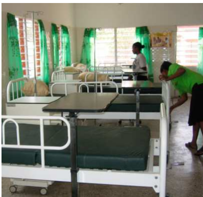
Interior servicio de maternidad

El Centro de Salud Benito Menni de Dompoase, Ghana, ha abierto un servicio de maternidad, el pasado 11 de febrero, coincidiendo con la jornada mundial del enfermo.