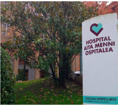
Entrada Hospital Aita Menni