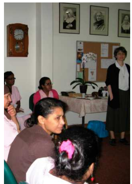
Trabajadores y voluntarios del centro

La iniciativa resultó muy positiva tanto para la Comunidad como para las personas que asistieron al acto, quienes mostraron un vivo interés por la vida de oración, el silencio y la Comunidad.