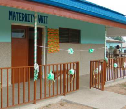
Fachada servicio de maternidad