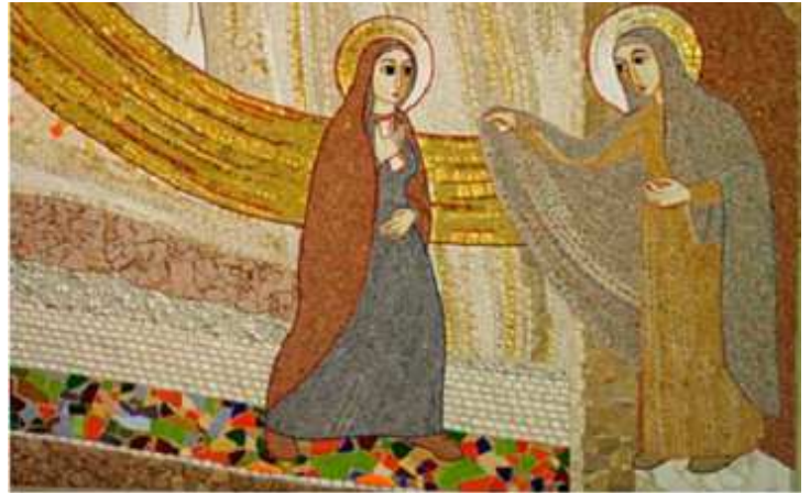
La visitación de María a su prima Isabel

El 31 de mayo de 2007 la Superiora general declara abierto el «proceso de reestructuración». El icono escogido para iluminar este proceso es la Visitación, “encuentro entre lo antiguo y lo nuevo [...], llamada a recrear el rostro femenino de la hospitalidad”.