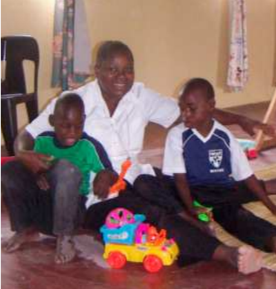
Interior del centro de Macia

El 11 de abril de 2012 las Hermanas Hospitalarias llegan a Macia, Mozambique, con un objetivo muy claro: servir a la atención hospitalaria en la diócesis de Xai-Xai, siguiendo los dones carismáticos hospitalarios. A lo largo de este tiempo