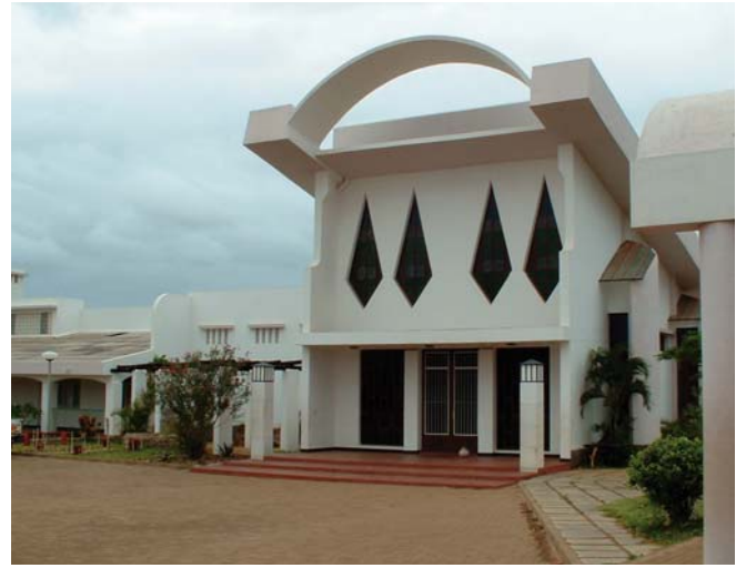
Hermanas y usuarios del Centro de Rehabilitación Psicosocial de Mahotas

El Centro de Rehabilitación Psicosocial de Mahotas (CRPS), situado a unos 30 km al noroeste de Maputo (Mozambique), inició su actividad en 1997 dedicado al tratamiento, rehabilitación y reinserción social/familiar de personas adultas con enfermedad mental , en colaboración con el Hospital Psiquiátrico Estatal.