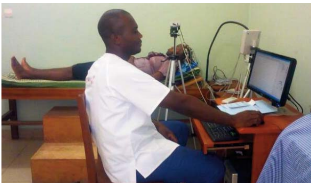
Actividad asistencial de Hermanas Hospitalarias en África

Nos reclaman desde muchos lugares del continente, y estamos convencidas de que "la lámpara de la hospitalidad" debe llegar a todos los rincones del mundo, porque la hospitalidad no tiene límites ni fronteras.