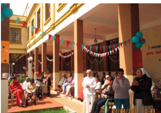
Celebraciones de la Fiesta de San Benito Menni

■ Eucaristía: concretamente el 24 de abril, se celebró una Eucaristía para toda la comunidad hospitalaria, donde todos los presentes compartieron momentos de unión y celebración.