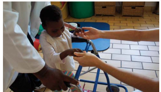
Actividad asistencial de Hermanas Hospitalarias en África