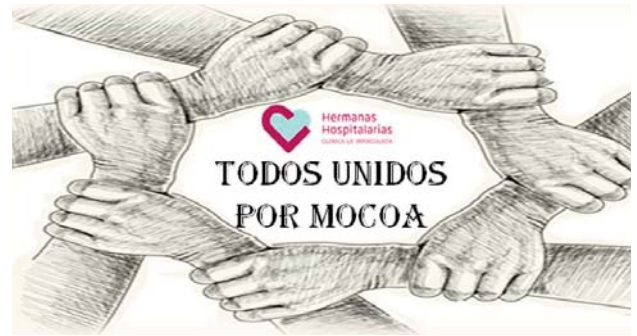
Eslogan e imagen de la campaña

Las grandes necesidades provocadas por este hecho, hicieron que se declarara el estado de emergencia y obligaron a buscar recursos en diversas fuentes, nacionales e internacionales. Ante