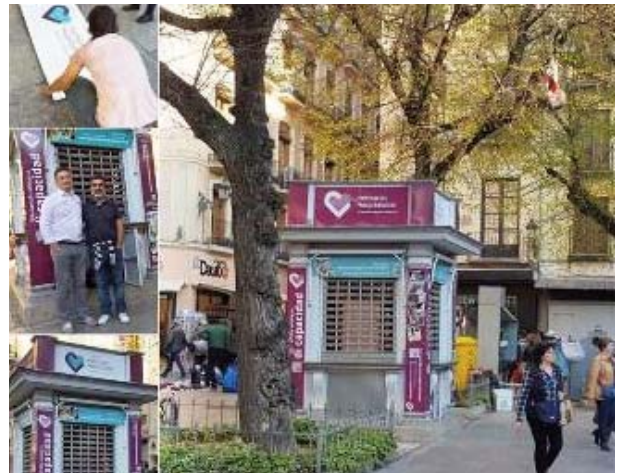
Quiosco de Hermanas Hospitalarias en Granada

peutas” con el que trabaja nuestra Institución, en diversos centros de la Provincia de España.